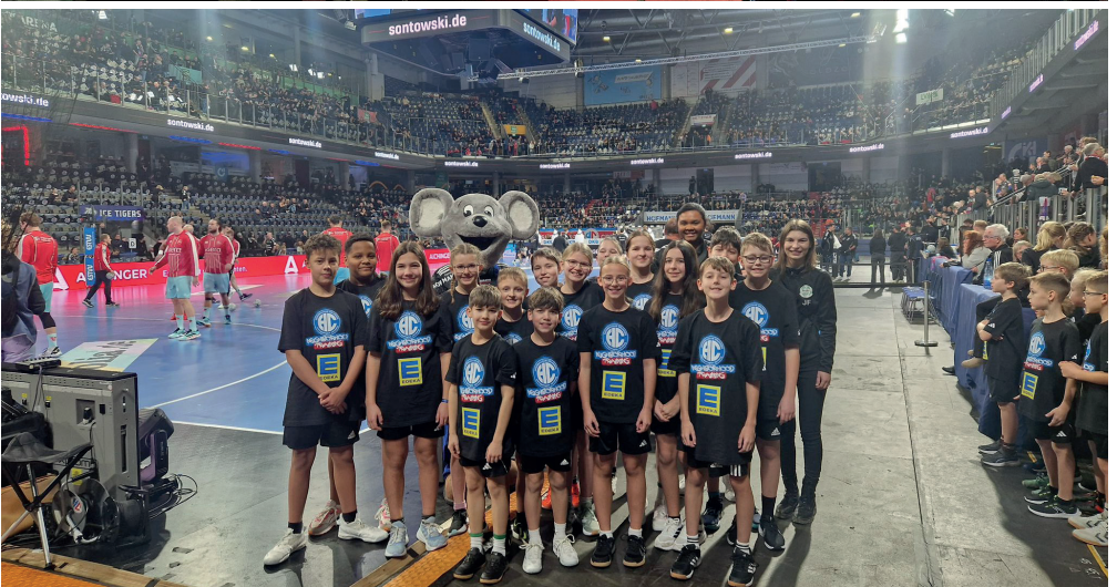
Ein besonderes Highlight: Unsere Jugendspieler als Einlaufkinder.